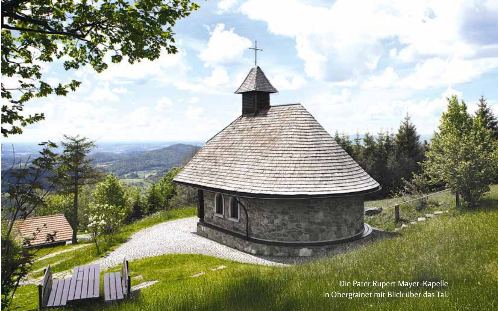
Die Pater Rupert Mayer-Kapelle in Obergrainet mit Blick über das Tal.

Häuser fertiggestellte Gotteshaus ist Pater Rupert Mayer geweiht. Ein anderer interessanter Wanderweg führt von Grainet aus bergan nach Hobelsberg und weiter durch lockeren Buchenwald zum Wallfahrtsort Kohlstattbrunn. Dort warten zwei schlichte, aus dem Volksglauben entstandene Kapellen auf Rast und Einkehr: Zum einen die aus Stein erbaute Maria Hilf-Kapelle (1895), zum anderen die Schächerkapelle, die mit alten Votivtafeln als ehrenwertes Symbol vieler Gebetserhörungen gilt. Die traditionelle Bründlwallfahrt, zu der jedes Jahr zahlreiche Pilger aufbrechen, findet jeweils am 15. August, an Maria Himmelfahrt statt. Der Hohlweg dorthin ist gesäumt von 14 Kreuzwegstationen.