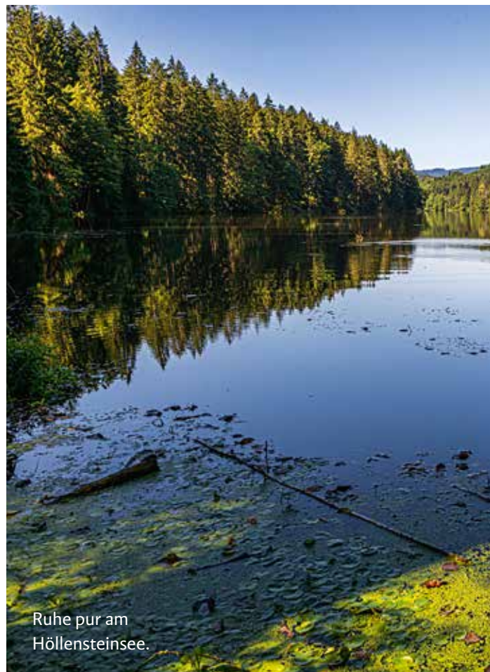
Ruhe pur am Höllensteinsee.

Der von 1923 bis 1926 – also vor genau 100 Jahren – angelegte Höllensteinsee staut das Wasser des Schwarzen Regen auf einer Länge von über fünf Kilometern. Die einst größte Talsperre Bayerns speist ein Wasserkraftwerk, das die Stromversorgung der Stadt Straubing sicherstellt – nachhaltige Energie, auch heute noch. Ich stehe auf der Staumauer des Kraftwerks, die Wasseroberfläche ist makellos glatt. Es herrscht eine friedliche Ruhe, nur hin und wieder sind die Rufe der Vögel zu hören. Fast könnte ich mich in den Wäldern Kanadas wähen. Die Hütte des Kanuverleihs, vor dem bunten Boote träge im Wasser schaukeln, ginge dabei bestens als Trapper-Hütte durch. Der Steig verläuft auf der Ostseite des Sees. Ein schmaler, wurzeliger Trail schlängelt sich nahe am